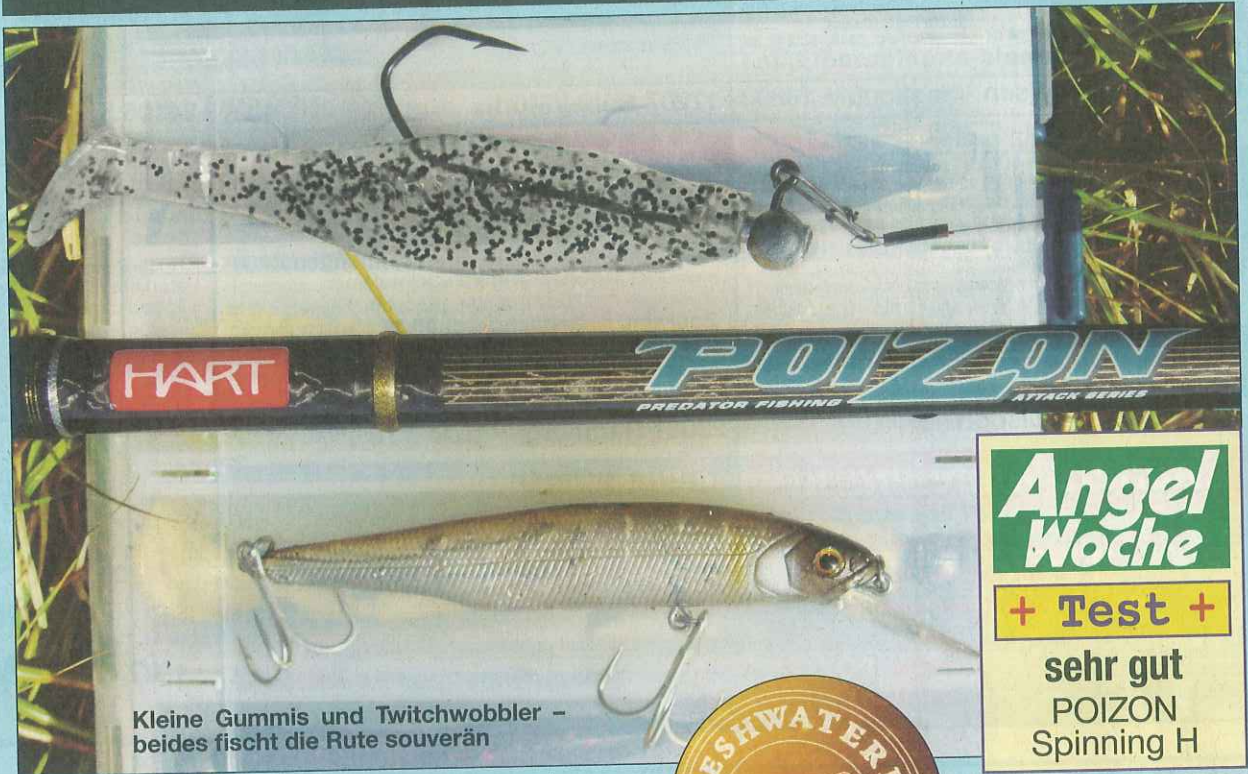
Kleine Gummis und Twitchwobbler – beides fischt die Rute souverän

„Streetfishing“ hat die von uns getestete „H“-Version mit 193 cm Länge das Potential zur „Kultrute“ zu