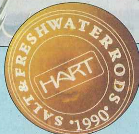
„HART“ Inbegriff moderner Ruten

avancieren. Aber auch der Hechtangler am Vereinsgewässer wird seine helle Freude damit haben.