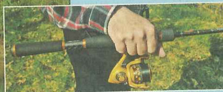
Die POIZON hat mit einer kleinen Rolle (20er) eine sehr gute Balance. Der Schwerpunkt liegt kurz hinter dem Vordergriff

◀ Ganz entscheidend ist die schnelle, aber gut biegsame Spitze