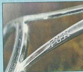
Die Rute ist komplett mit Fuji Alconite beringt